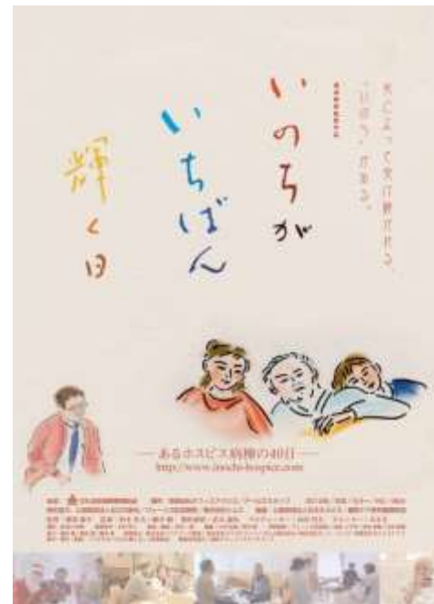
溝淵雅幸監督作品 「いのちがいちばん輝く日～あるホスピス病棟の40日～」(2013年2月 全国劇場公開)